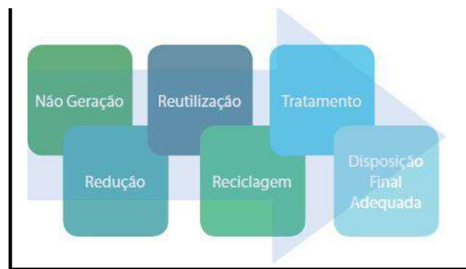
Figura 2: Escala de prioridade na gestão de resíduos sólidos.